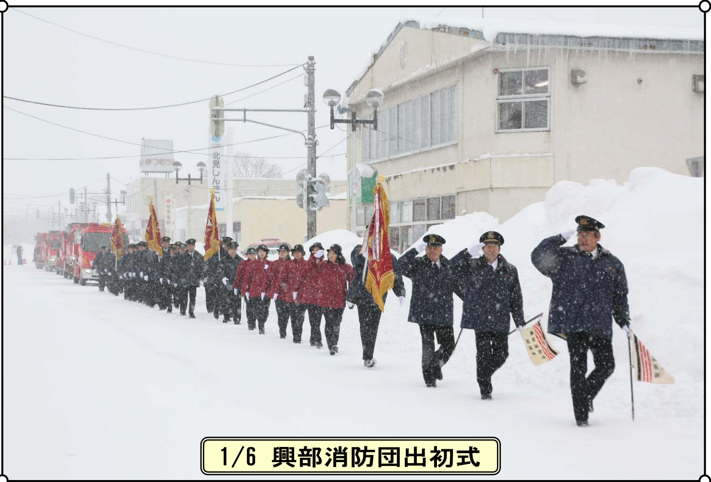
1/6 興部消防団出初式